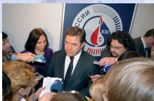
Участие в пленарной дискуссии С. Шматко, Министра энергетики РФ, вызвало большой интерес у журналистов